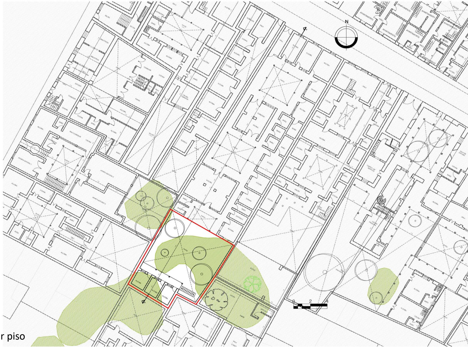
Planta primer piso